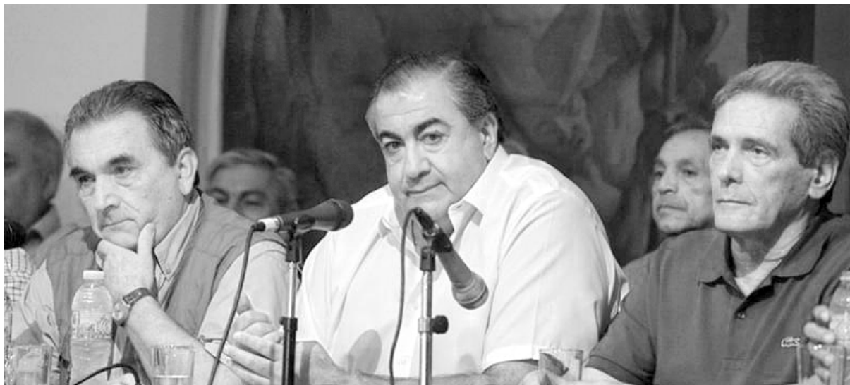
El triunvirato cómplice del ajuste