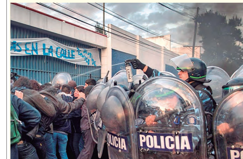
Macri ordenó la represión