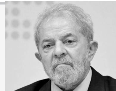
Luis Ignacio “Lula” Da Silva

y políticos burgueses hasta abarcar a los principales dirigentes de todos los partidos burgueses y a algunos de los más importantes empresarios. Quedó en evidencia la existencia de un cartel de grandes constructoras que a cambio de los contratos de Petrobras financiaban las campañas de los partidos patronales como el PT de Lula y Dilma, el PMDB de Temer y el PSDB de Henrique Fernando Cardoso, entregando jugosos sobornos. El trasfondo de estos procesos judiciales,