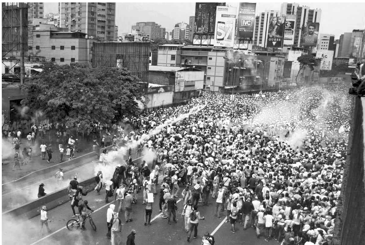
Movilización en Caracas