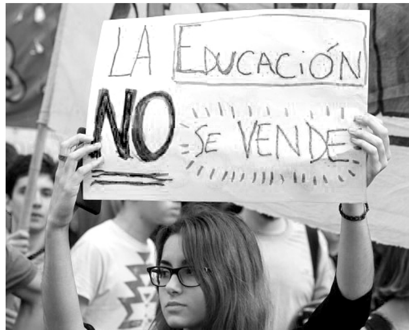
Los estudiantes vienen pelando contra el ajuste a la educación

Hacemos estas propuestas porque pensamos que la actual situa-