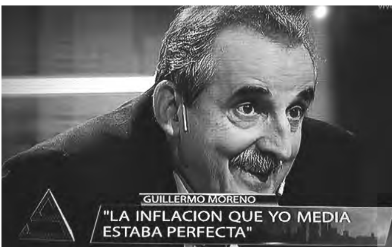
Un enemigo de los trabajadores

En estos días salió a la luz un peritaje de la Universidad Nacional de La Plata (UNLP) que descubrió como se hacía exactamente la truchada: en el sistema informático del Indec se había instalado un programa secreto llamado "Ipn_Calind_