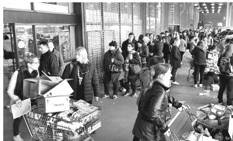
Largas colas para comprar con descuentos en supermercado de La Plata

Las patronales argumentarán que no tienen plata. ¡Mentira! Miremos sus ganancias. Vienen levantando millonadas año a año. A muchas se las exime de impuestos (como a las exportadoras agrícolas