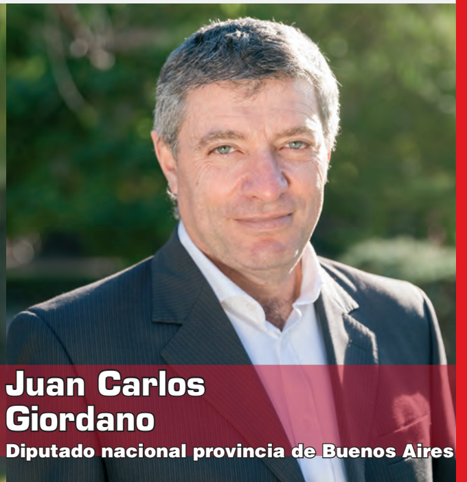
Juan Carlos Giordano

Diputada nacional Ciudad de Buenos Aires